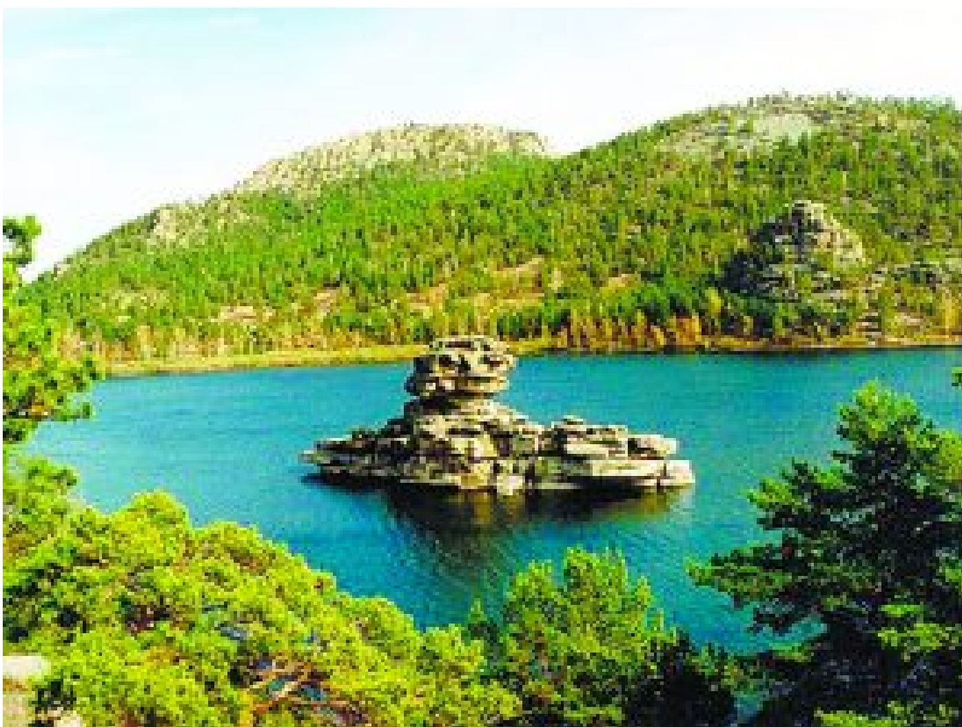
( http://economics.kazgazeta.kz/?p=23130 )

Баршаға ортақ байлық ( http://economics.kazgazeta.kz/?p=23153 )