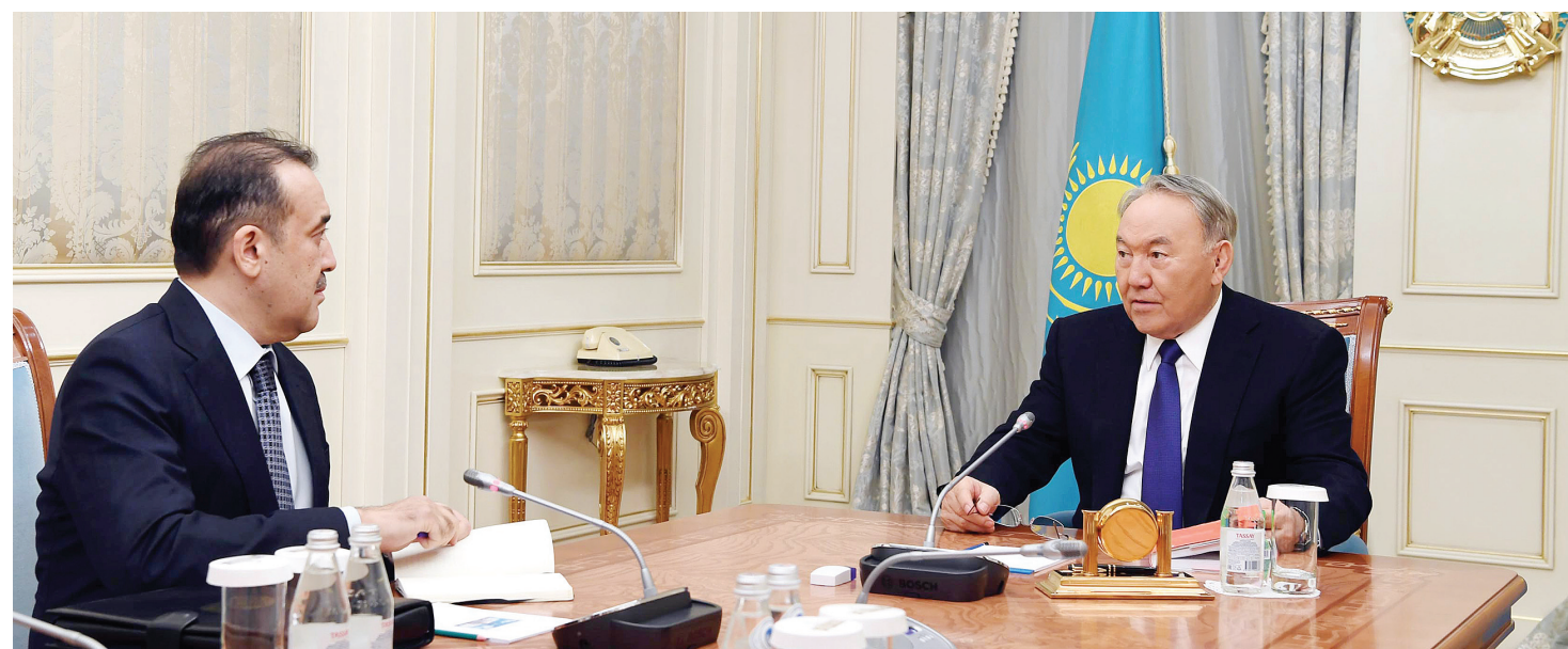
Елбасы Нұрсұлтан Назарбаев Ұлттық қауіпсіздік комитетінің төрағасы Көрім Мәсімовті қабылдады.

Мемлекет басшысына Комитеттің қазіргі қызметі мен алдағы кезеңге арналған міндеттері жөнінде мәлімделді.